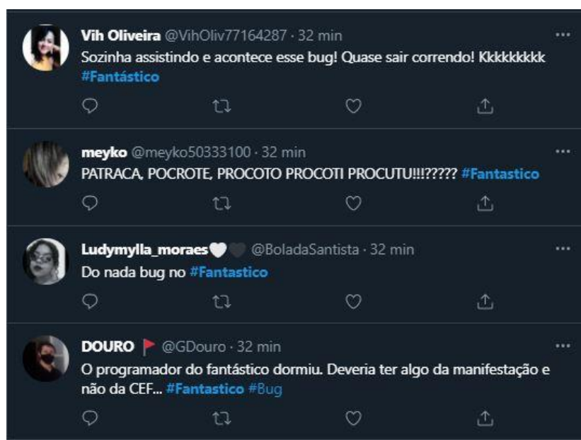
Figura 24: Telespectadores comentam falha técnica no Fantástico

Outro ponto interessante observado é que, embora os telespectadores-internautas se dividam em mais de uma tela, é que a atenção deles se voltou para a TV quando ocorreu um erro técnico aconteceu na edição do dia 30 de maio. Era exibida uma reportagem sobre o novo programa da Rede Globo, e ao invés de ir ao ar o áudio da dublagem para a resposta do entrevistado estrangeiro, foi ao ar o áudio de uma outra reportagem e de um outro repórter emitindo sons de exercícios vocais 32 . A falha logo chamou a atenção dos telespectadores que foram ao Twitter comentar, como podemos ver na Figura 24.