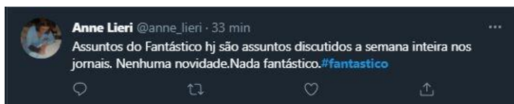
Figura 20: Comentário sobre assuntos repetidos

Em 13 de junho, uma telespectadora criticou os assuntos abordados no programa que, segundo ela, nada mais era do que repetições de tudo que já havia sido noticiado ao longo da semana (ver Figura 20). Esse comentário também mostra o desafio de um programa jornalístico semanal conseguir inovar e buscar outros ângulos de acontecimentos já mostrados.