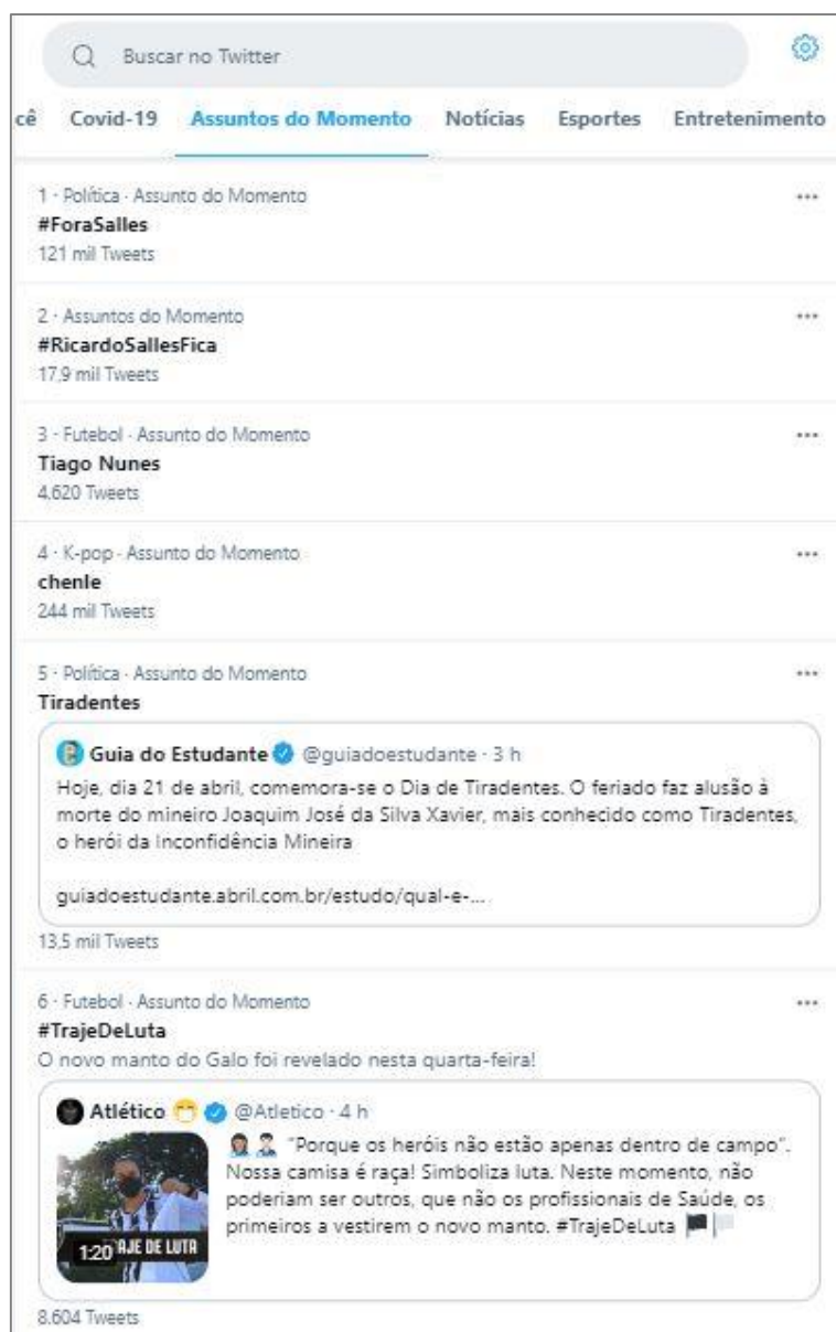
Figura 4. Lista com os Assuntos do Momento no Twitter.

Na Figura 4 é possível ver as editorias no canto superior do site e o contador de tweets abaixo de cada hashtag ou palavra-chave da lista que ajuda o usuário a ter uma noção da relevância do assunto. O Twitter foi a primeira rede social a popularizar o recurso da hashtag – sinalizada pelo símbolo do jogo da velha (#) seguido da palavra que indica o assunto (RECUERO, 2009) – para identificar o tema ao qual o usuário comenta; ela funciona como indicadora e permite que as conversas sejam agrupadas, pois basta clicar nela que o site mostra todos os tweets que foram publicados sobre aquilo.