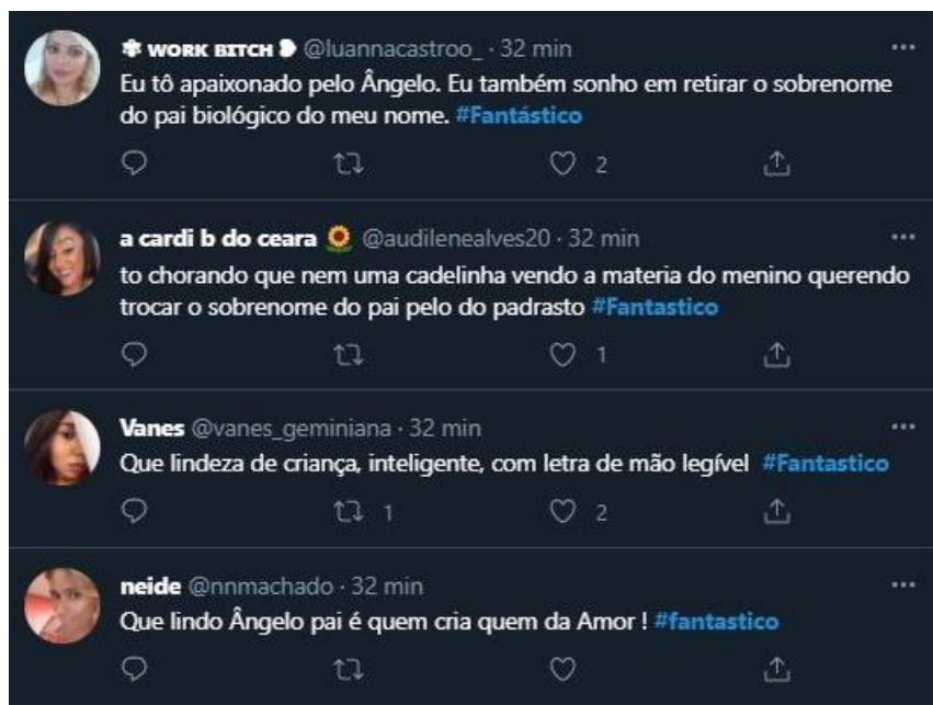
Figura 7: Telespectadores se comovem com história exibida no Fantástico.

Na edição do dia 6 de junho, foi mostrada a história de um menino de 8 anos que escreveu sozinho uma carta para a juíza de sua região, pedindo para que o sobrenome do padrasto substituísse o sobrenome do seu pai biológico na certidão de nascimento, sob a justificativa de que pai é aquele que cuida 19 . Logo, a história chamou a atenção dos telespectadores que foram comentar no Twitter sobre a emoção que sentiram.