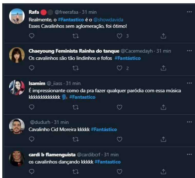
Figura 23: Tweets feito sobre a parte de futebol do programa

Com a tradição de encerrar o programa sempre com um resumo dos jogos de futebol do domingo, há alguns anos o Fantástico tem adotado uma carga de humor para narrar os lances, com o apoio dos “cavalinhos” – fantoches que comentam rapidamente os jogos –, o que desperta a atenção do telespectador e gera publicações.