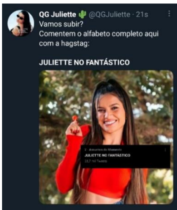
Figura 25: Fã incentivava que usuários continuem publicando tweets

mostra que havia uma mobilização de perfis criados por fãs para movimentar o termo nos Trending Topics .