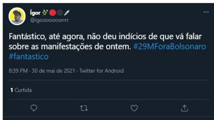
Figura 16: Cobrança foi feita duas horas antes de notícia ir ao ar

Com o caso de violência policial na cidade de Recife durante manifestações políticas ocorreu algo semelhante. Durante toda edição do dia 30 de maio foram publicados tweets em tom de cobrança, questionando por qual motivo o programa não estava abordando o assunto (Figura 16). E após uma nota coberta 29 curta, teve telespectador que se sentiu lesado, como mostra o print da Figura 17.