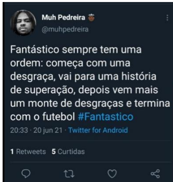
Figura 13: Telespectadores identifica padrão no programa

Mesmo o telespectador usando um tom de exagero ao se referir as outras notícias veiculadas, fica claro que a reportagem com uma história de superação é facilmente identificada porque é um formato que se repete nas edições.