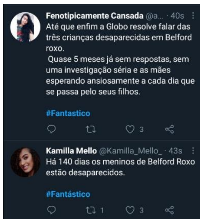
Figura 15: Telespectadores comentam exibição de reportagem

Nas figuras acima é possível perceber que a hashtag #Fantástico foi usada para fazer uma cobrança quase dois meses antes do programa falar sobre o caso, e que, mesmo falando sobre, teve comentário em tom de crítica pela demora. Logo, a hashtag foi usada como um canal de comunicação, outra constatação que vamos analisar mais à frente.