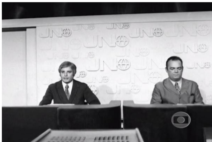
Figura 2. Cid Moreira e Hilton Gomes na bancada do Jornal Nacional.

A tecnologia das externas e o aumento de emissoras pelo país contribuíram para a criação do Jornal Nacional (Figura 2) como o primeiro telejornal em rede, com notícias de diferentes lugares do país e com a inserção de entrada ao vivo dos repórteres.