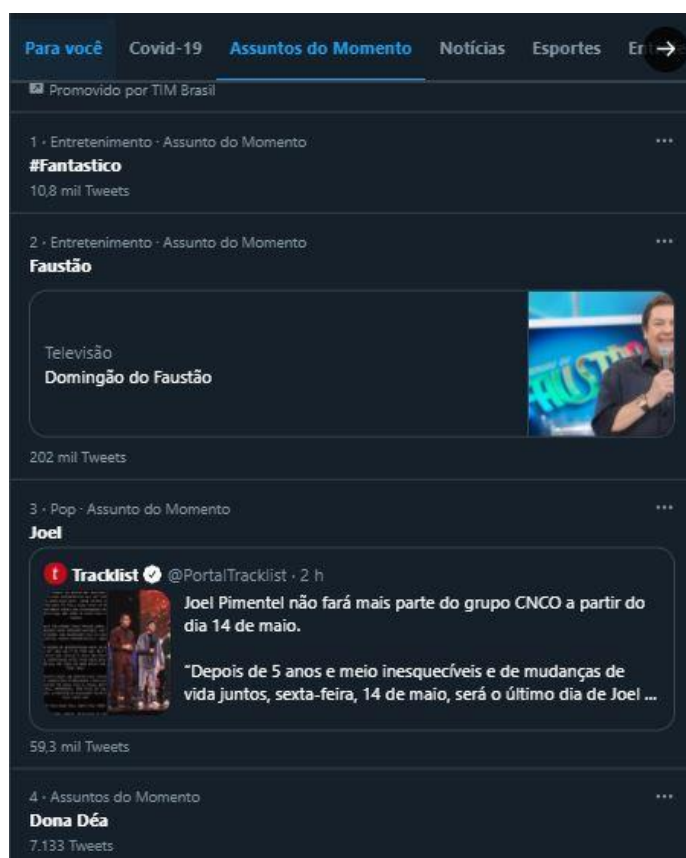
Figura 10: #Fantástico aparece em 1º lugar nos Assuntos do Momento