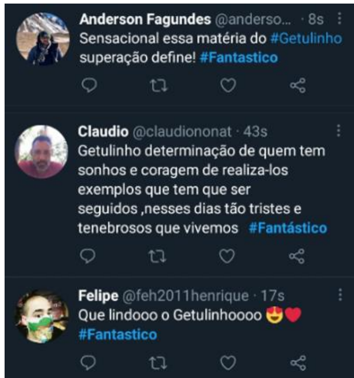
Figura 8: Telespectadores comovidos com personagem mostrado

Além de buscar e explorar boas histórias como as citadas acima, no período de análise o Fantástico noticiou sobre a morte de duas figuras públicas e famosas: o ator Paulo Gustavo e o ex-governador de São Paulo, Bruno Covas, assuntos que tiveram grande repercussão na mídia e nas plataformas de redes sociais, por se tratarem de pessoas nacionalmente conhecidas e que tinham milhares de fãs e apoiadores, e também porque antes da morte, ambos ficaram internados com a imprensa atualizando diariamente seus boletins médicos.