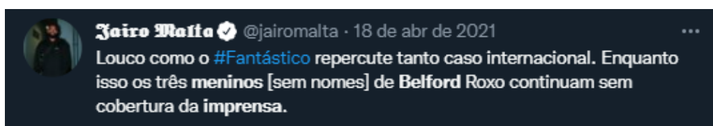
Figura 14: Cobrança para que o Fantástico fale sobre caso de desaparecidos

que três crianças negras haviam desaparecido no município de Belford Roxo, no Rio de Janeiro, e a falta de pistas comoveu muitas pessoas que iam às redes sociais para cobrarem uma cobertura expressiva por parte da imprensa para que talvez, assim, a polícia intensificasse as investigações e localizassem a criança. Foram meses de cobranças, inclusive, algumas direcionadas ao Fantástico (Figura 14), meses antes do programa ter conteúdo abordar o assunto. A reportagem foi ao ar no dia 16 de junho 28 , 140 dias após o desaparecimento e também gerou comentários contendo #Fantástico (Figura 15).