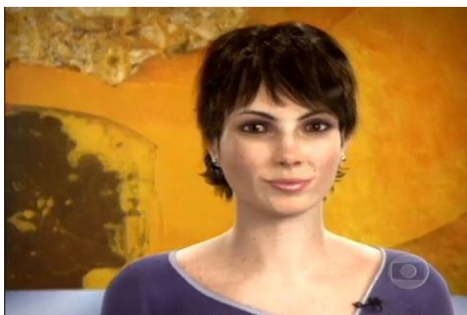
Figura 6: Apresentadora virtual do Fantástico Eva Byte.

Em 2003, com a internet se popularizando no Brasil, o programa criou a primeira apresentadora virtual da TV brasileira, a Eva Byte (Figura 6). A apresentadora, que ficou no ar até o ano de 2009, era uma animação computadorizada e dublada que aparecia esporadicamente chamando reportagens e/ou fazendo entrevistas, o nome, inclusive, foi escolhido numa votação popular que teve um bom engajamento do público. Para a época, a criação de uma apresentadora virtual foi considerada uma grande inovação tecnológica tendo em vista que a tecnologia usada na animação permitia que ela apresentasse expressões faciais próximas da realidade de forma rápida. Com essa tática o Fantástico conseguiu se mostrar “futurista” e envolver a audiência com a votação para o nome.