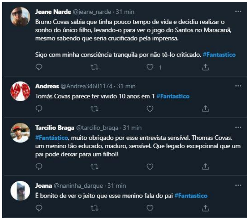
Figura 12: Telespectadores comentam sobre entrevista com Tomás Covas

Na Figura 12 vemos que um dos telespectadores do print , até agradeceu ao programa pela matéria, utilizando a hashtag como meio de comunicação com a equipe do programa.