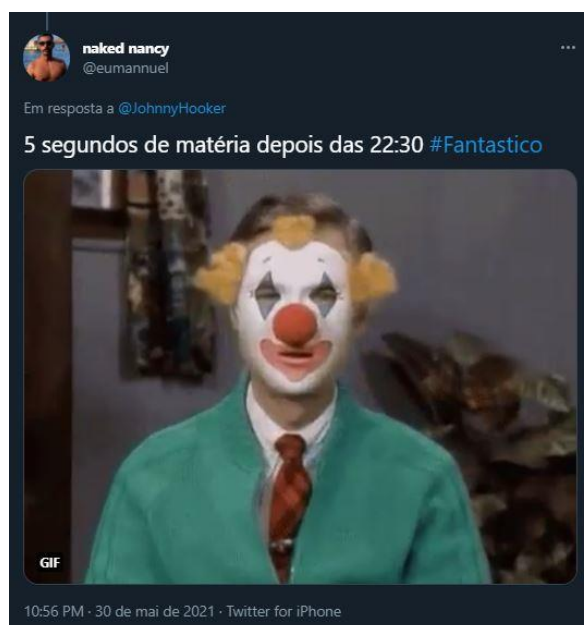
Figura 17: Telespectador questiona o tempo curto para o assunto

No entanto, no domingo seguinte, o Fantástico começou com os depoimentos das vítimas da violência policial 30 , narrando os fatos ocorridos no dia 29 de maio, numa reportagem de 14 minutos, que trazia outros personagens que também haviam sofrido