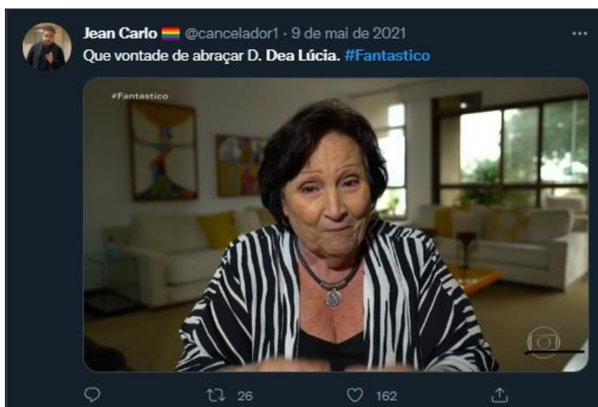
Figura 9: Telespectador se solidariza com mãe de Paulo Gustavo

Não por acaso, essa foi a data que teve mais publicações com #Fantástico. Quando o programa acabou, tinham sido cerca de 37 mil tweets , de acordo com a plataforma.