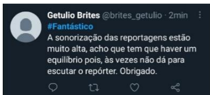
Figura 18: Telespectadores comentam exibição de reportagem

Amorim (2010) acredita que a internet despertou um senso crítico em boa parte dos usuários fazendo com que eles expressem suas considerações sobre o que está sendo transmitido na TV, “não basta acompanhar o programa, o telespectador/internauta sente a necessidade de compartilhar sua opinião sobre ele” (AMORIM, 2010, p. 156), e a plataforma do Twitter facilita esse compartilhamento e expõe para os outros usuários da rede social.