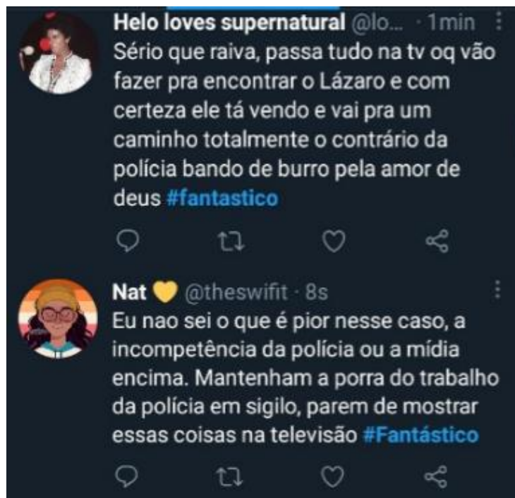
Figura 19: Telespectadores reclamam sobre exposição de operação policial

Em 13 de junho, uma telespectadora criticou os assuntos abordados no programa que, segundo ela, nada mais era do que repetições de tudo que já havia sido noticiado ao longo da semana (ver Figura 20). Esse comentário também mostra o desafio de um programa jornalístico semanal conseguir inovar e buscar outros ângulos de acontecimentos já mostrados.