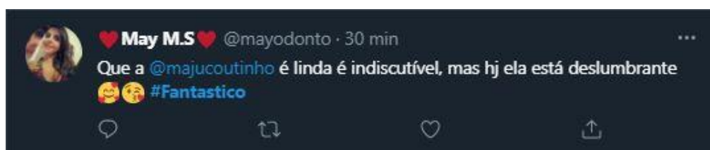
Figura 22: Comentários sobre a apresentadora Maju Coutinho

Com a tradição de encerrar o programa sempre com um resumo dos jogos de futebol do domingo, há alguns anos o Fantástico tem adotado uma carga de humor para narrar os lances, com o apoio dos “cavalinhos” – fantoches que comentam rapidamente os jogos –, o que desperta a atenção do telespectador e gera publicações.