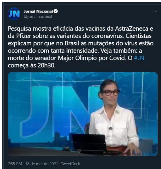
Figura 3. Jornal Nacional usa o perfil no Twitter para fazer uma chamada.

A implantação e popularização da internet entre os brasileiros acarretou o uso das plataformas das redes sociais, por meio desses sites que investiam nas conexões online entre pessoas, o telejornalismo se tornou expandido devido a cibercultura. O conteúdo foi então expandido para outros formatos e plataformas e ocorreu uma “apropriação dos veículos de televisão pelas redes sociais que têm o audiovisual como ferramenta” (SILVA, 2019, p. 31). Os telejornais também aproveitam as redes sociais para atrair a audiência para a TV, com informações sobre o que ainda será exibido, instigando o internauta a ligar sua televisão. Como podemos observar abaixo na Figura 3, o perfil oficial do Jornal Nacional no Twitter postou cerca de uma hora antes do início da edição as manchetes do dia.