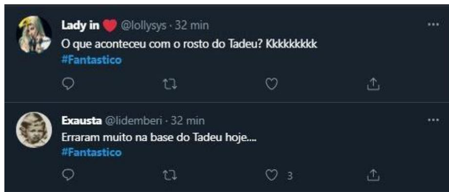
Figura 21: Comentários sobre o apresentador Tadeu Schmidt